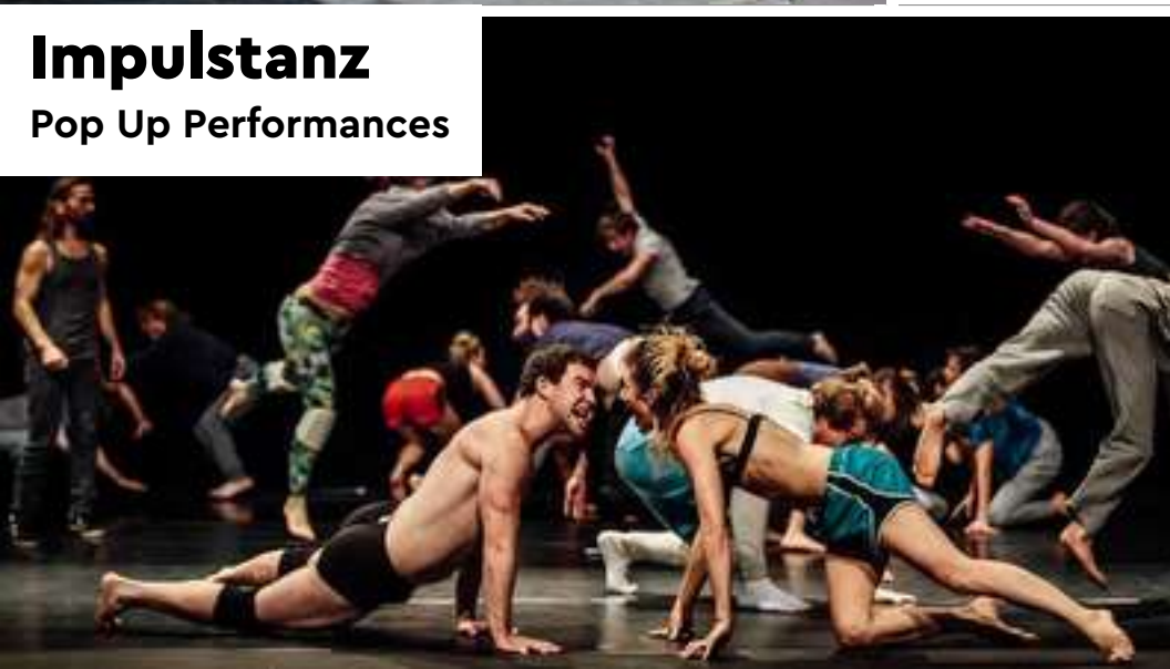
Impulstanz Pop Up Performances