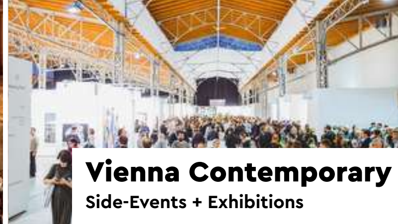
Vienna Contemporary Side-Events + Exhibitions