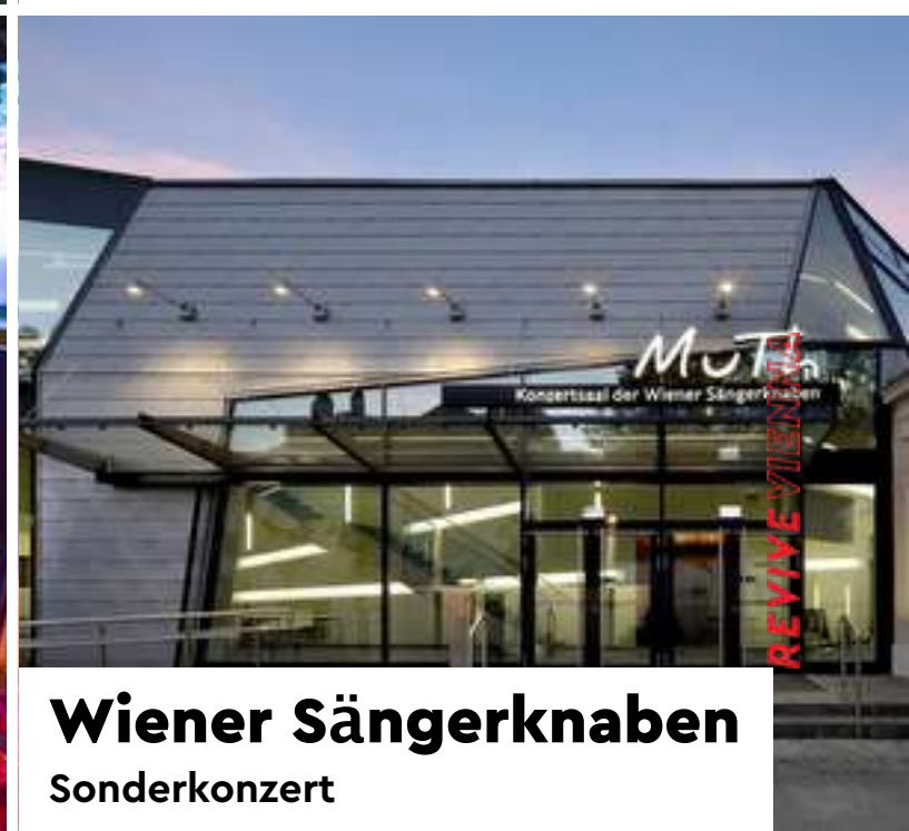
Wiener Sängerknaben Sonderkonzert