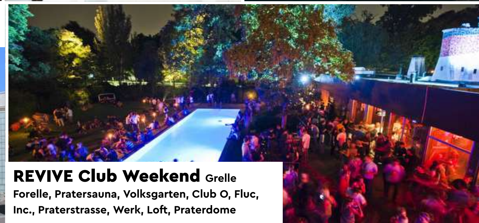
REVIVE Club Weekend Grelle Forelle, Pratersauna, Volksgarten, Club O, Fluc, Inc., Praterstrasse, Werk, Loft, Praterdome