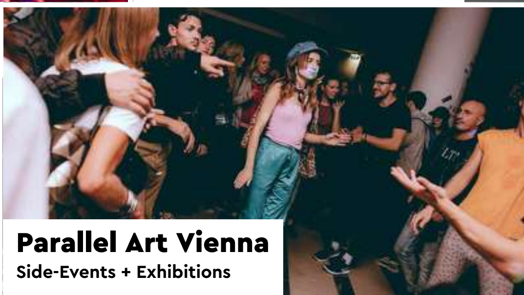
Parallel Art Vienna Side-Events + Exhibitions