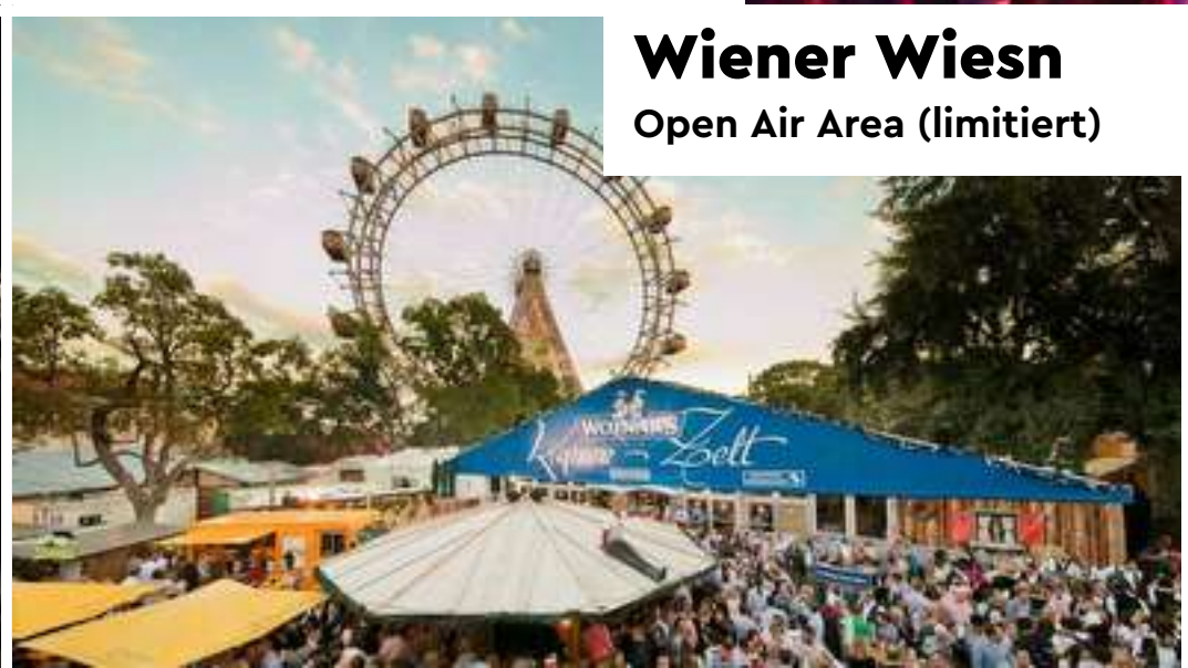
Wiener Wiesn Open Air Area (limitiert)