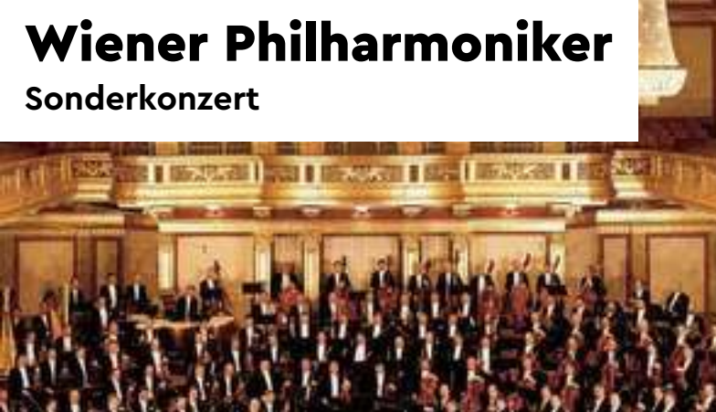
Wiener Philharmoniker Sonderkonzert