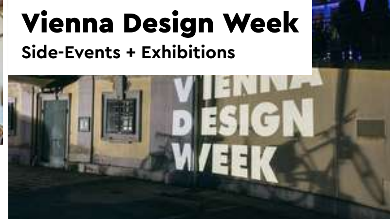
Vienna Design Week Side-Events + Exhibitions