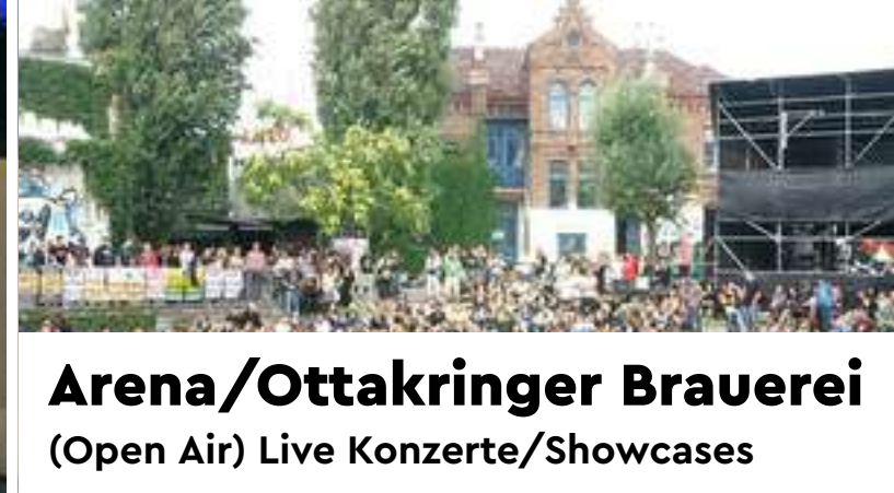
Arena/Ottakringer Brauerei (Open Air) Live Konzerte/Showcases